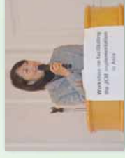
丸川環境大臣によるスピーチ